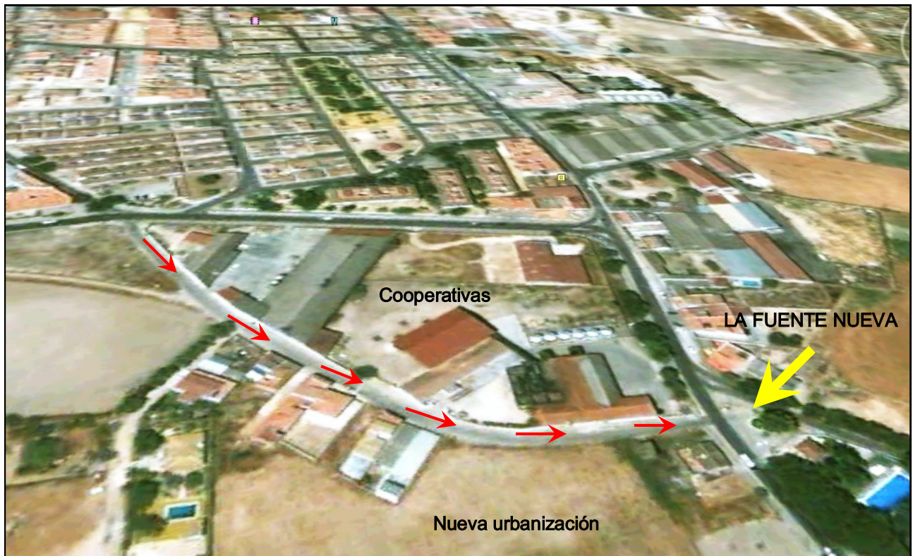
FOTO AÉREA DE LA CALLE DE LA FUENTE NUEVA

En la imagen se observan las dos cooperativas agrarias en uno de los márgenes de la calle y en el margen opuesto recientemente se ha construido una nueva urbanización a la que se pretende dotar de una zona de recreación o esparcimiento con éste proyecto. Además en la vía se localizan 4 domicilios particulares cuyos habitantes sufren la falta de iluminación y el mal estado en general de ésta salida desde el casco urbano. Al final de la vía se encuentra la casa los Peones Camineros en la que el Ayuntamiento de la Rambla tiene intención de llevar a cabo una actuación con el fin de mejorar el estado en que se encuentra y evitar su progresiva degradación con el tiempo.